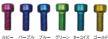
ルビー パープル ブルー グリーン ターコイズ ゴールド